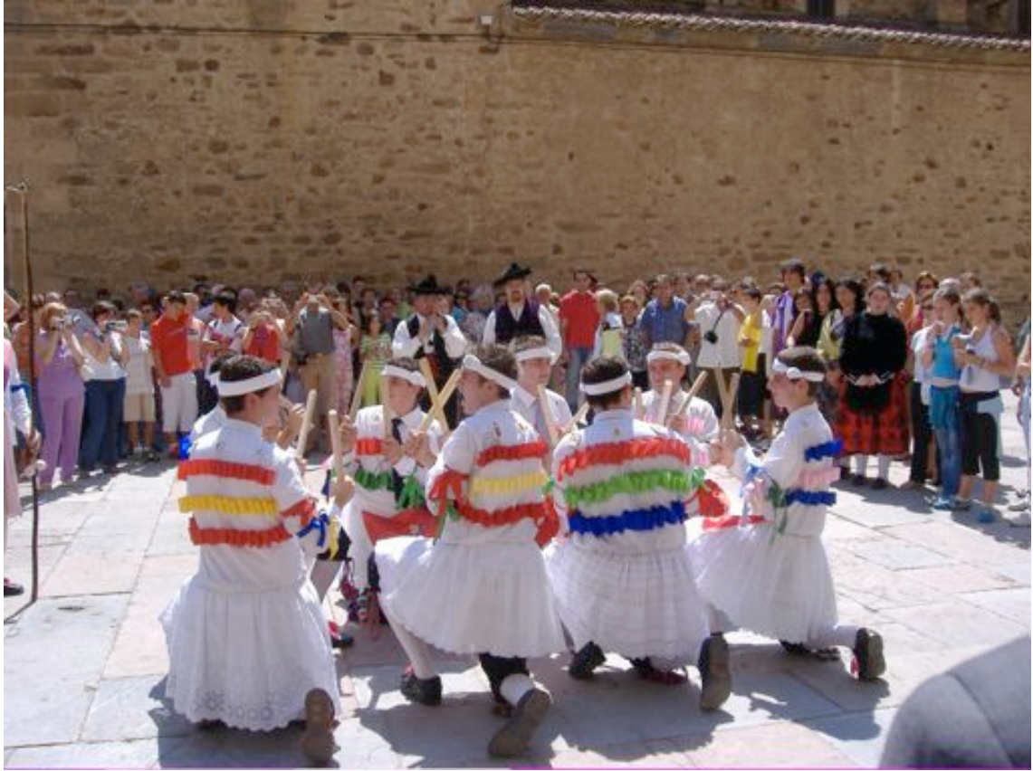
Homenaje al Húsar Tiburcio en Astorga. Año 2005