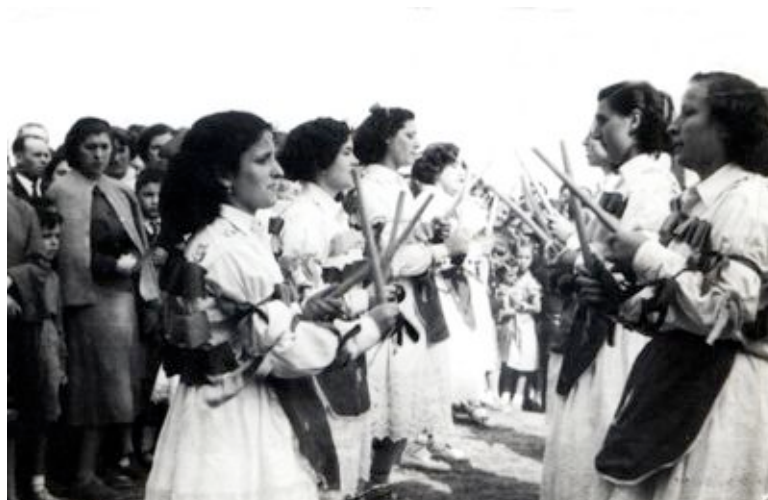
Sección Femenina. Grupo Flechas de Villafrades de Campos en romería de San Isidro. Año 1950.

grupo de Íscar, obteniendo la puntuación de 10 y destacando en el expediente del jurado la precisión y temperamento a la hora de ejecutar las danzas.