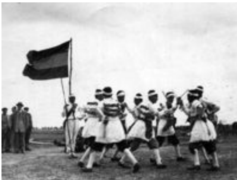
Danzantes en concursos de arada

Este hecho que se repitió durante algunos años hizo que durante estos viajes los danzantes también fueron invitados a actuar en algunos edificios emblemáticos como el Casino de la ciudad.