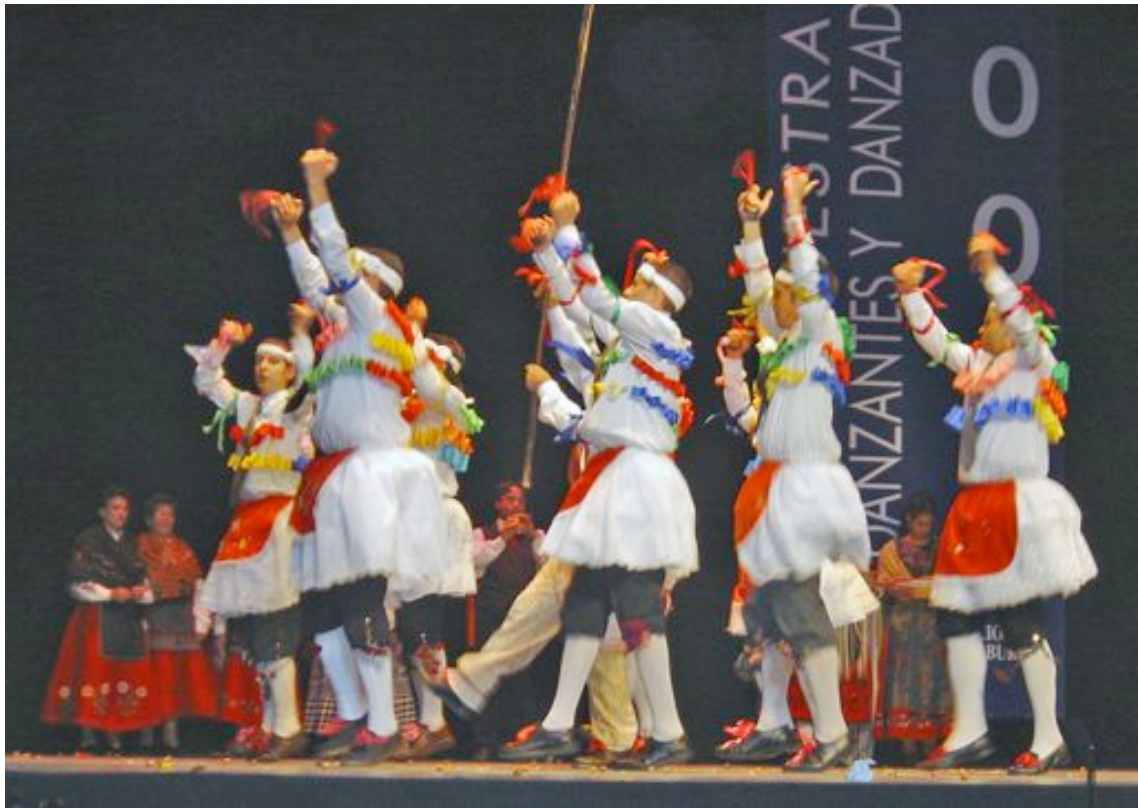
Teatro Principal de Burgos. Año 2004