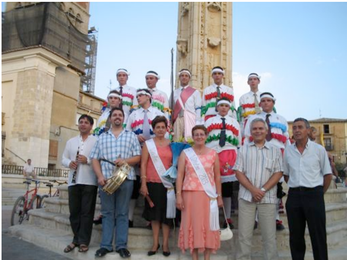
Villalón de Campos. Elección de la maja (Asociación La Florida). Año 2005