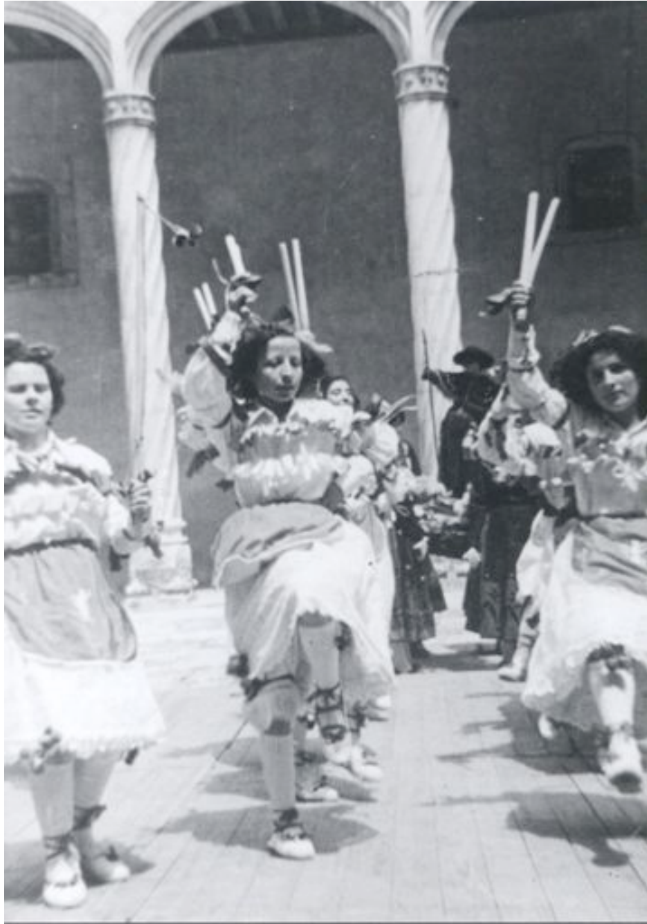
Sección Femenina. Concurso en San Gregorio. Año 1950.